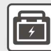
ポータブル蓄電池